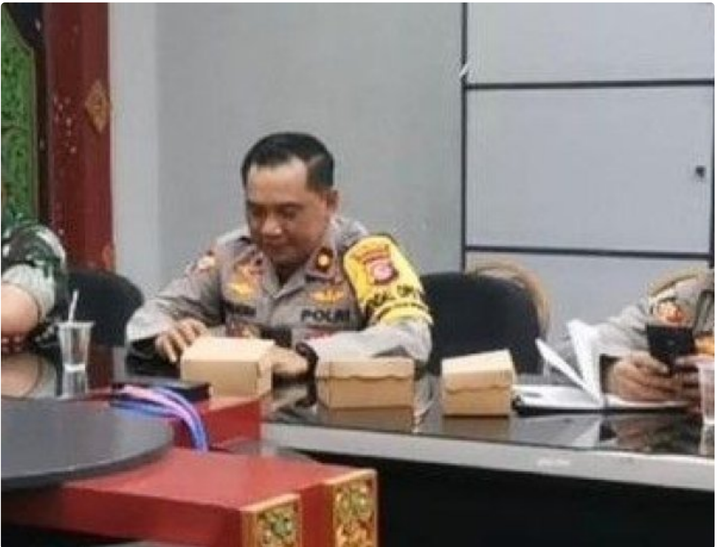
Kabagops Polresta Mataram saat menghadiri Rakor di Kantor Bupati Lombok Barat, Selasa (10/12/2024)

MATARAM, NTB – Dua tradisi budaya ikonik, Pujawali dan Perang Ketupat, akan kembali digelar di Pura Lingsar, Kecamatan Lingsar, Kabupaten Lombok Barat. Persiapan event tahunan ini kian dimatangkan oleh Pemerintah Kabupaten